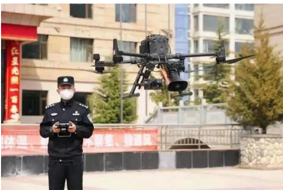
警察与无人机。

据悉，有的家庭教会领袖被软禁或被迫搬家，教会成员被禁止聚会，这些情形有的与成都大运会相关。