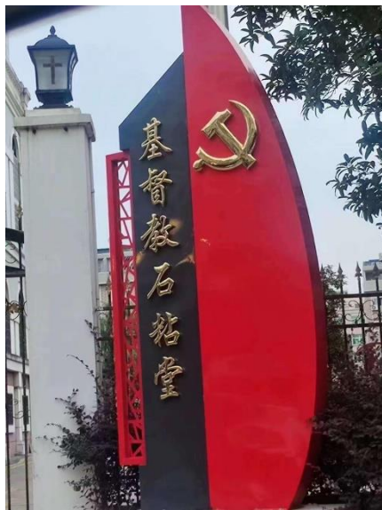
浙江省台州市基督教石粘堂门牌加上了中共党徽。