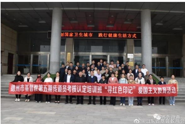
2023 年 5 月，山东省德州市基督教三自会传道员考核认定培训及爱国主义教育。

虽然目前尚不清楚这一信用评价制度如何界定会导致宗教领袖“差”或“很差”信用等级评定的“不良行为”，但该计划将赋予当局权力，进一步限制宗教教职人员在教义和实践中的宗教信仰表达。