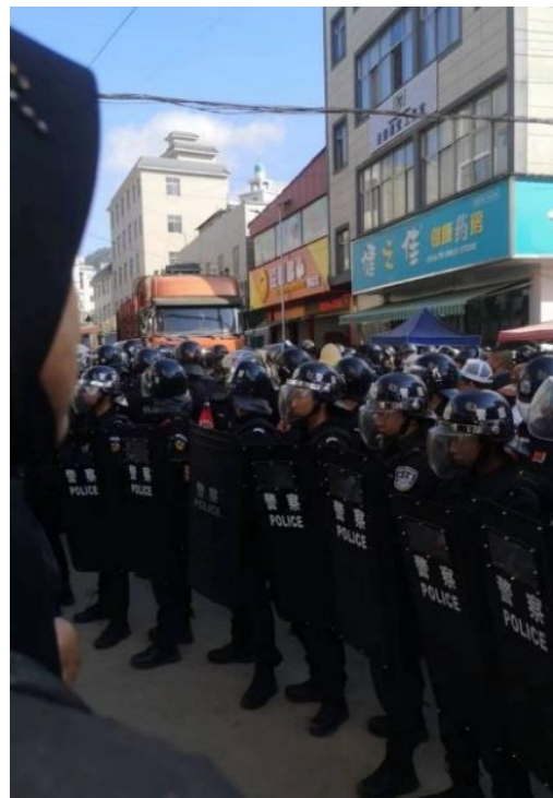
2023 年 5 月 27 日纳家营外的警察。

五月，云南发生一起穆斯林反对强拆清真寺穹顶的群体抗议事件，令中国回族穆斯林在“宗教中国化”中的遭遇引起了国际关注（详情见第一部分）。网络上还传出未经证实的关于云南有壮族穆斯林逝世后遗体 被强制火化 的消息。