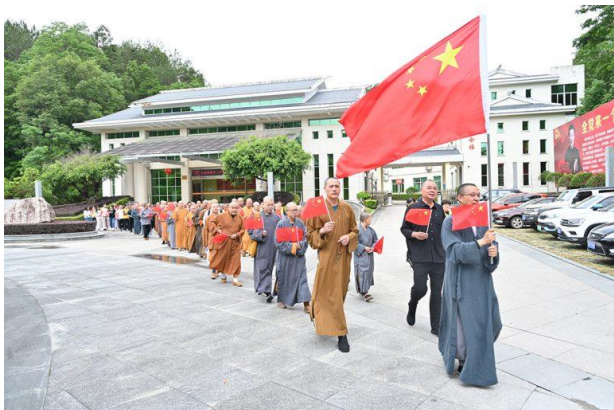
2023 年 5 月 7 日，龙岩市佛教协会“爱党、爱国、爱社会主义”活动。