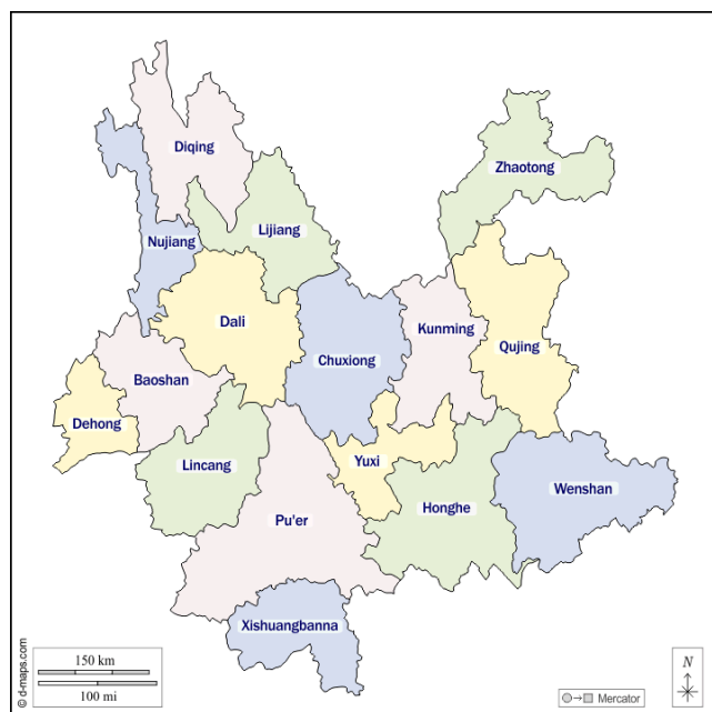
云南省 16 个地级行政区地图。

云南的宗教历史悠久，宗教信徒人口众多。根据云南省统战部的 网站 ，该省五种主要宗教都有；信众最多的是佛教，其次是道教、伊斯兰教、天主教和新教。佛教的三大教派都有，即汉传佛教、藏传佛教和南传上座部佛教，其中南传上座部佛教在中国只见于云南。此外，还有许多人信奉少数民族的民间信仰。