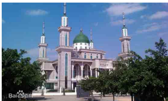
穹顶被拆除之前的田心清真寺。