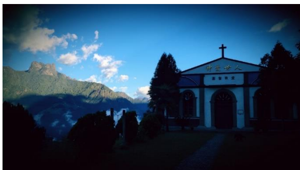
十字架被移除之前的老姆登教堂。

■ 2021 年 4 月 30 日，福贡县皮河怒族乡政府关闭了老姆登教堂，理由是会友没有接种疫苗，称“疫情期间暂停使用宗教场所”。