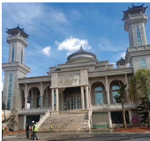
经过改造的田心清真寺。

■ 2022年1月1日，《云南省宗教事务条例》经省人大批准后生效。与2016年云南省政府颁布的 规定 相比，添加了一些新的规定，包括“坚持中国共产党的领导，全面贯彻党的宗教工作基本方针，坚持我国宗教的中国化方向”。