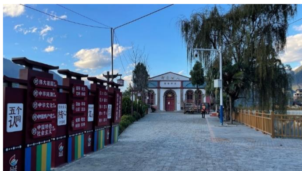
老姆登教堂现在没有了十字架，门外多了一排政治标语牌。

■ 2021 年 5 月 7 日，曲靖市陆良县一名资姓“门徒会”核心成员被警方刑事拘留。