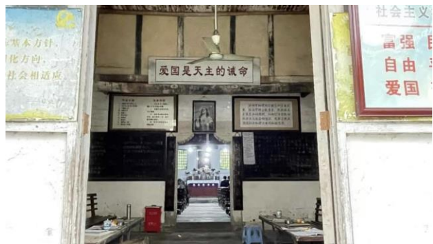
政治标语进了天主教堂：“爱国是天主的诫命”。

香港前主教陈日君枢机曾 谴责 该协议是对中国政府的“投降”、对中国地下天主教徒的“ 出卖 ”。他被控未登记帮助香港民主抗议者的人道基金，已于 2022 年 11 月被 定罪 、罚款。