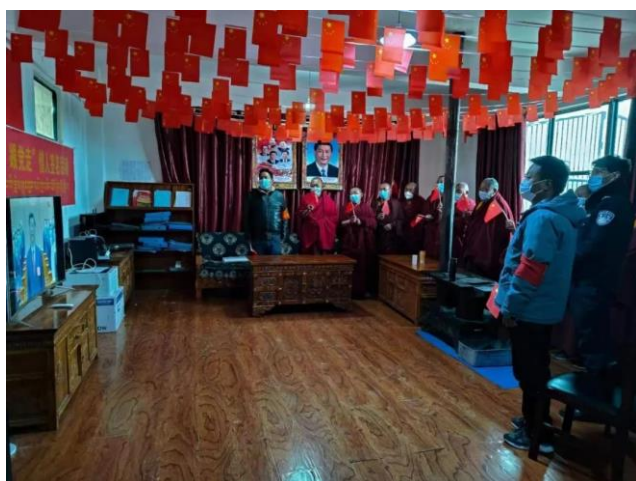
西藏僧人与警察观看中共二十大开幕式。

全国各地来自各行各业、各种宗教背景、不同年龄的民众都被组织起来观看学习习近平的党代会报告。